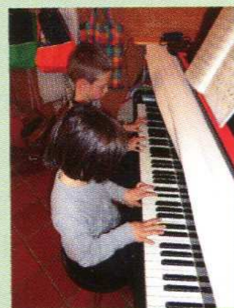
Attenzione, movimento, relazione.